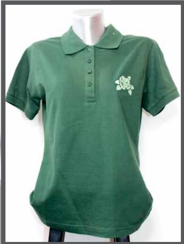
ŠIFRA PROIZVODA: 102 -019