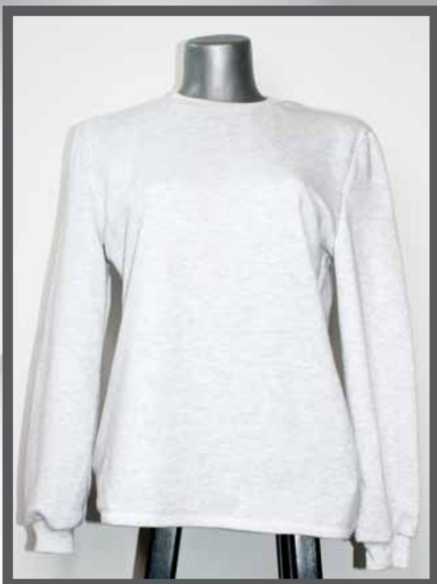
ŠIFRA PROIZVODA: 106 -07