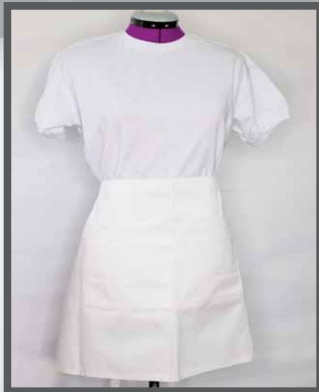
ŠIFRA PROIZVODA: 101-06