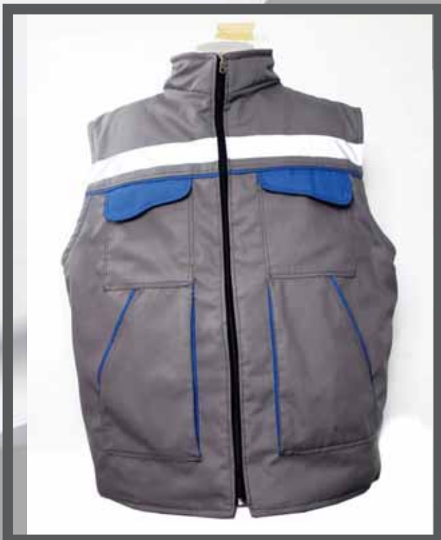
ŠIFRA PROIZVODA: 100-03