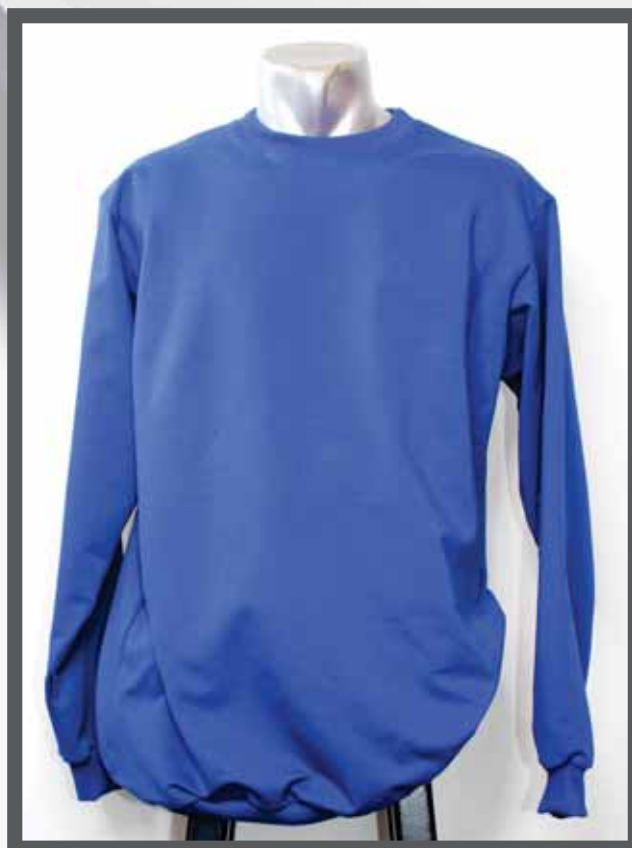
ŠIFRA PROIZVODA: 102 -06

NAZIV PROIZVODA: MUŠKE MEAJICE DUGI RUKAV