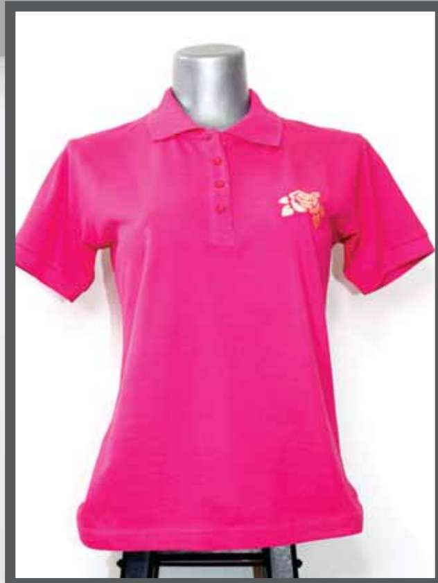
ŠIFRA PROIZVODA: 102 -020