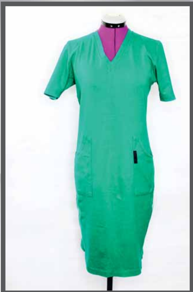
ŠIFRA PROIZVODA: 101-03