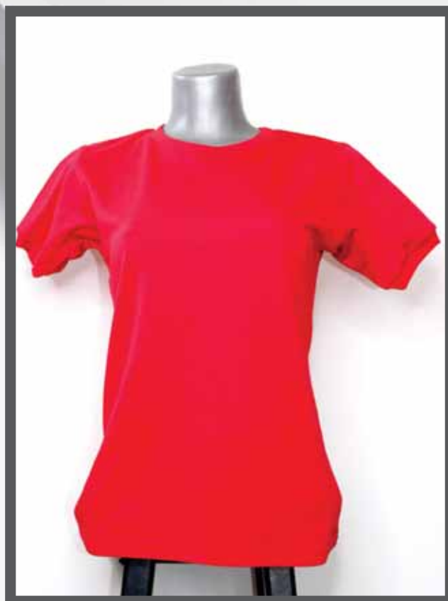
ŠIFRA PROIZVODA: 102 -027