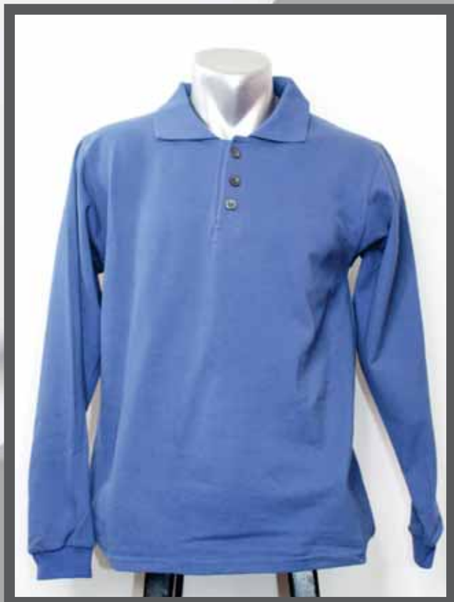
ŠIFRA PROIZVODA: 102 -03