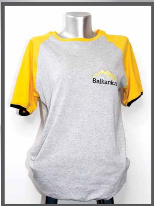
ŠIFRA PROIZVODA: 102 -021