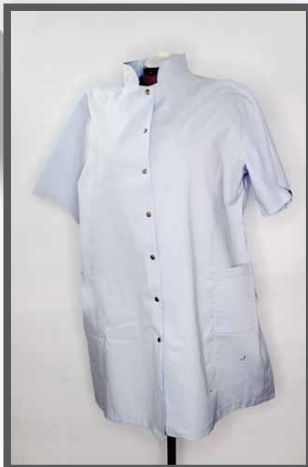
ŠIFRA PROIZVODA: 100-093

NAZIV PROIZVODA: KECELJE I MEDICINSKI MANTILI