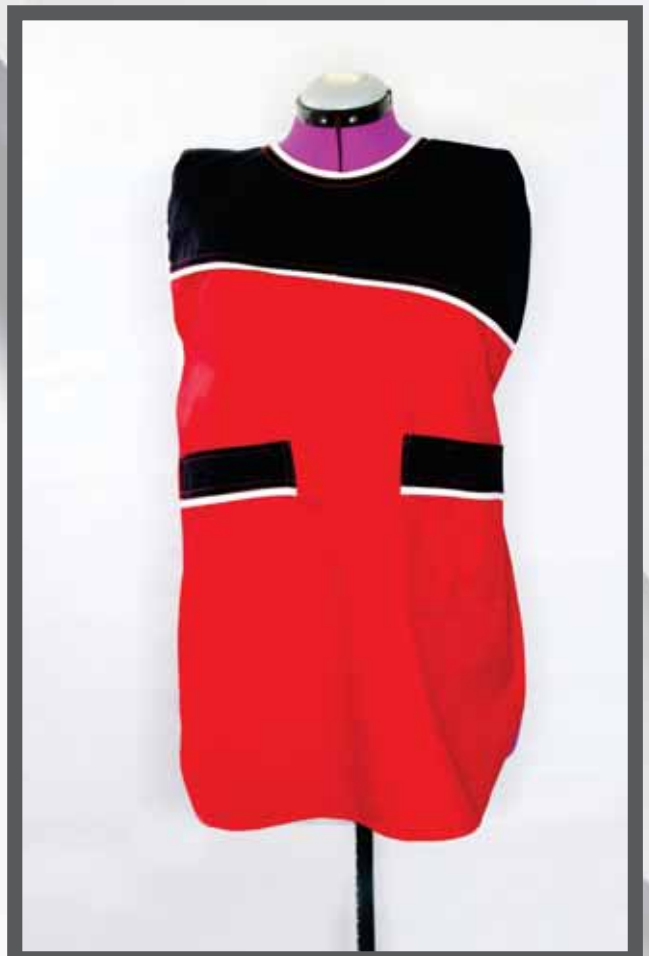
ŠIFRA PROIZVODA: 101-04