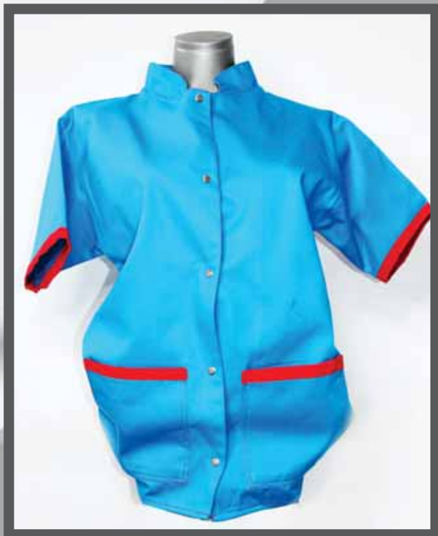
ŠIFRA PROIZVODA: 100-085