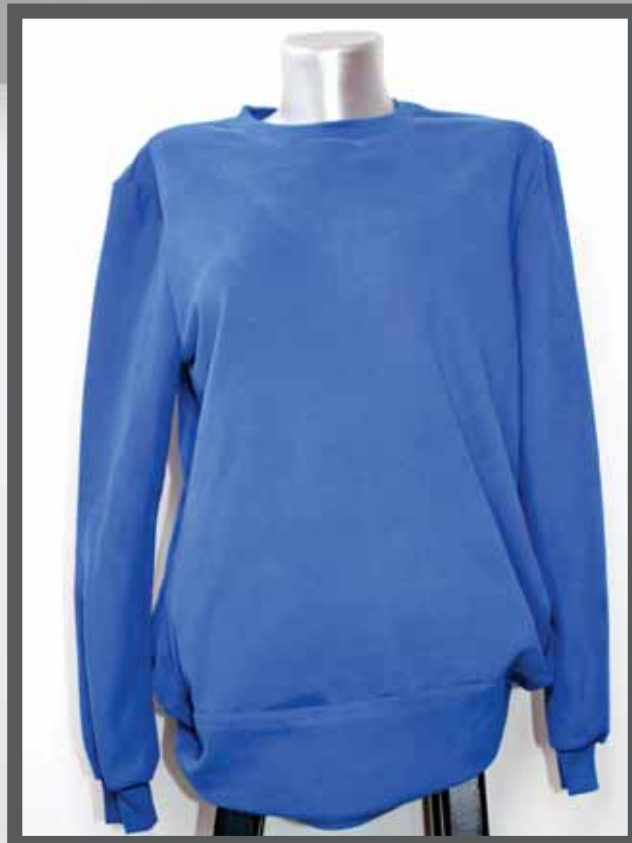
ŠIFRA PROIZVODA: 106 -06