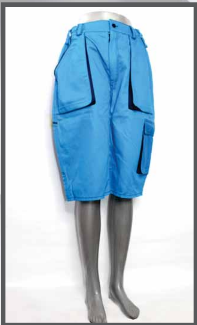
ŠIFRA PROIZVODA: 105 -01