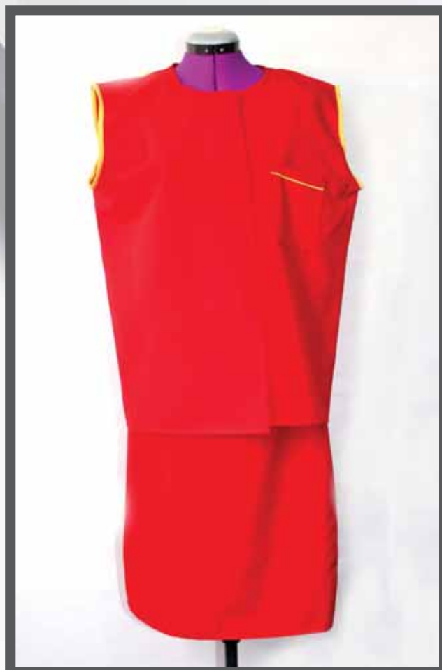
ŠIFRA PROIZVODA: 100-095

NAZIV PROIZVODA: KECELJE I UGOSTITELJSKE UNIFORME