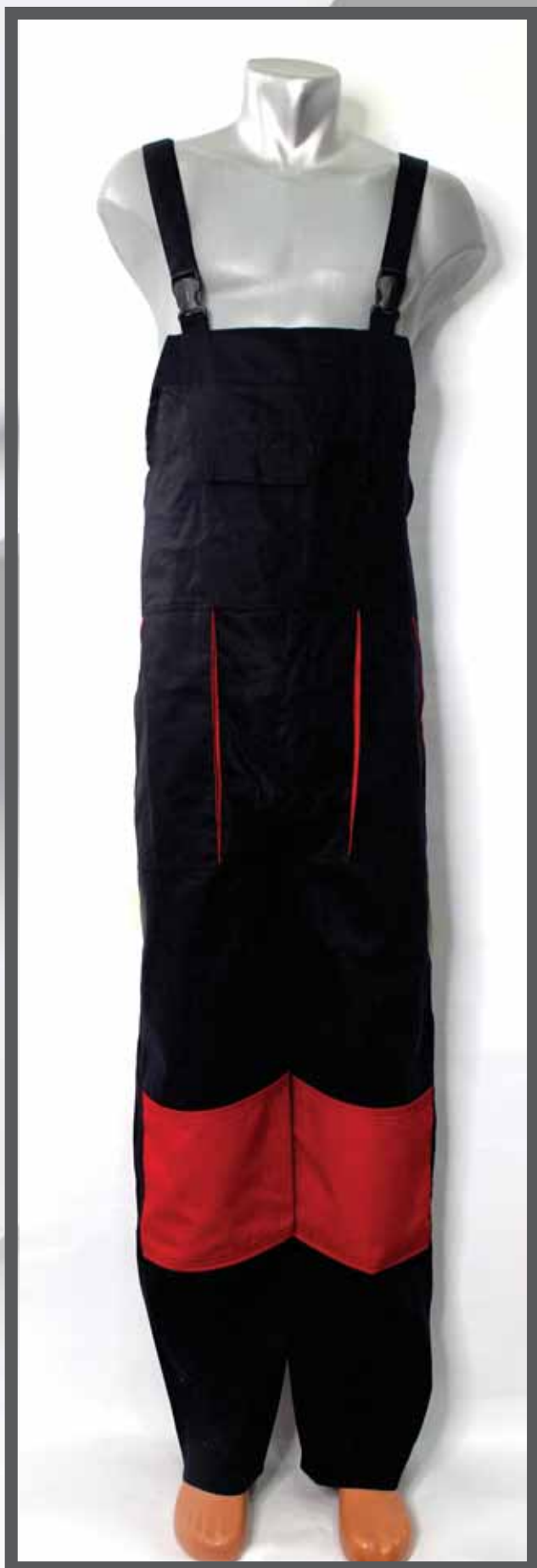
ŠIFRA PROIZVODA: 100-019