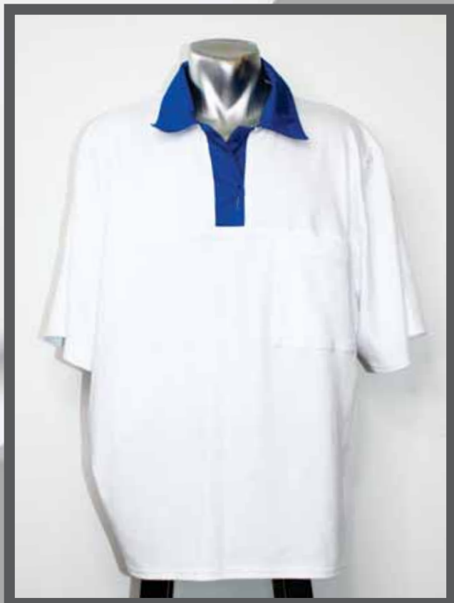
ŠIFRA PROIZVODA: 102 -015