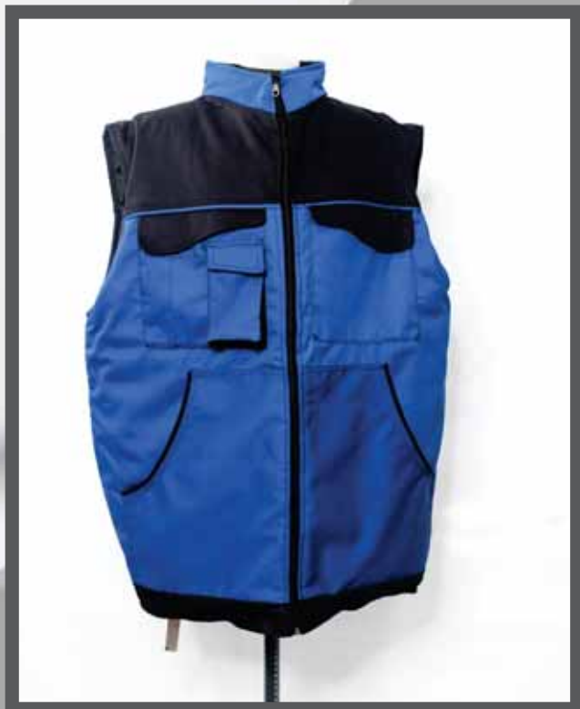
ŠIFRA PROIZVODA: 100-01