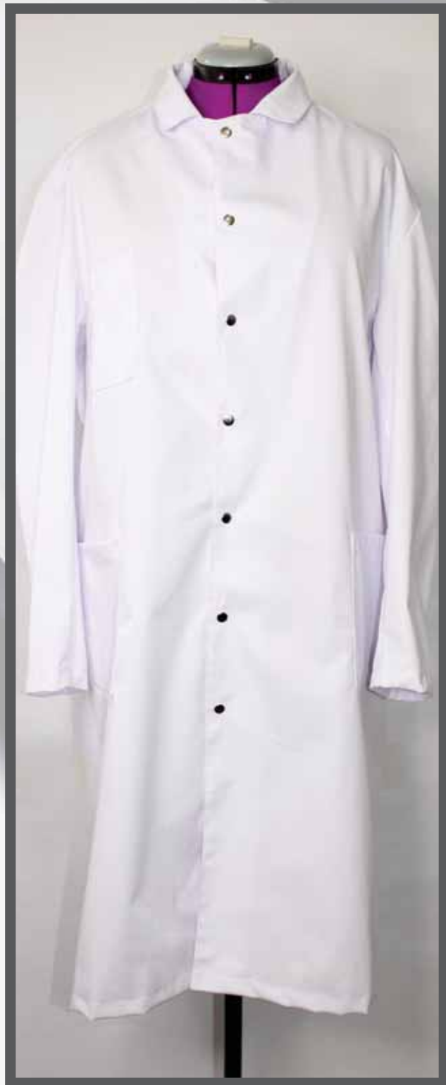
ŠIFRA PROIZVODA: 100-082