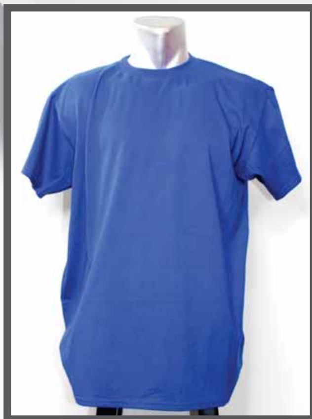
ŠIFRA PROIZVODA: 102 -018