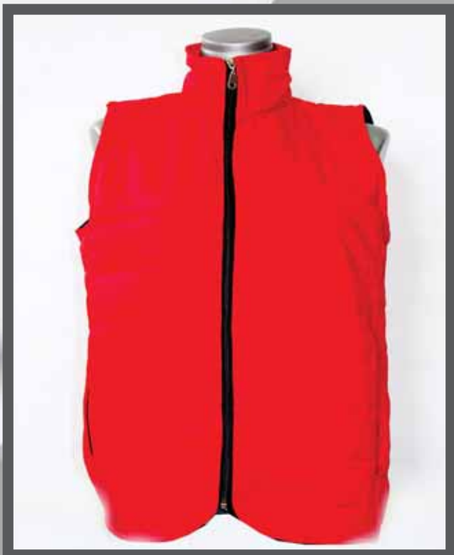
ŠIFRA PROIZVODA: 100-088