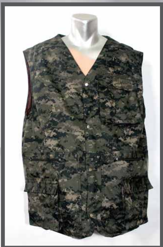
ŠIFRA PROIZVODA: 100-090