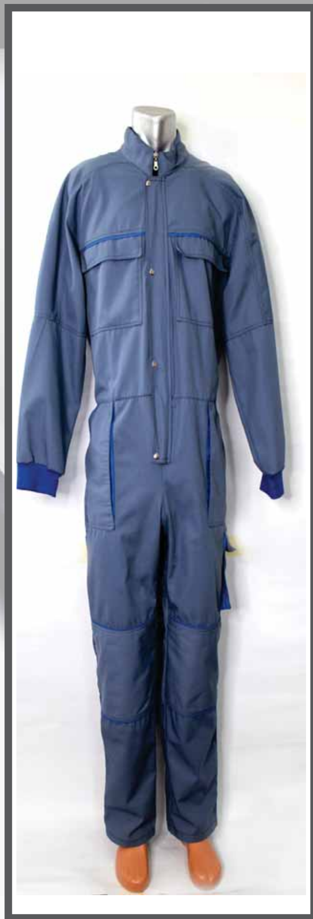
ŠIFRA PROIZVODA: 100-038