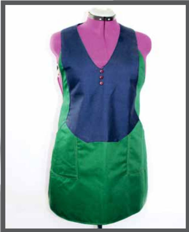
ŠIFRA PROIZVODA: 101-01