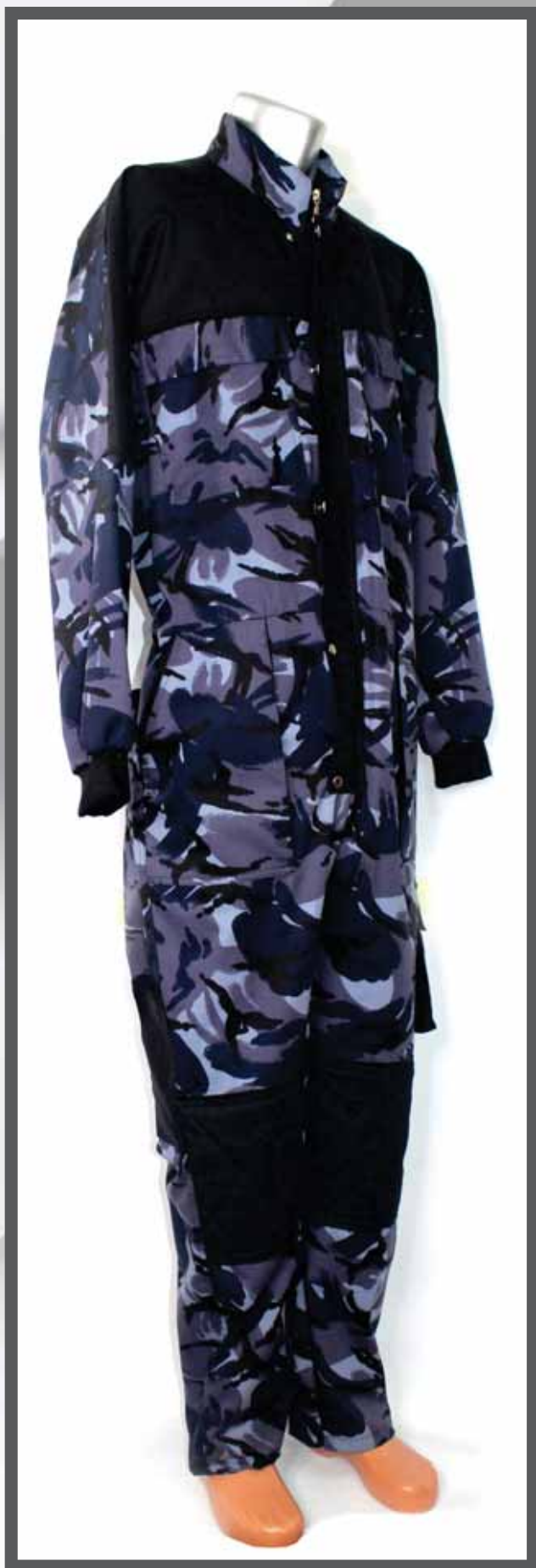
ŠIFRA PROIZVODA: 100-037