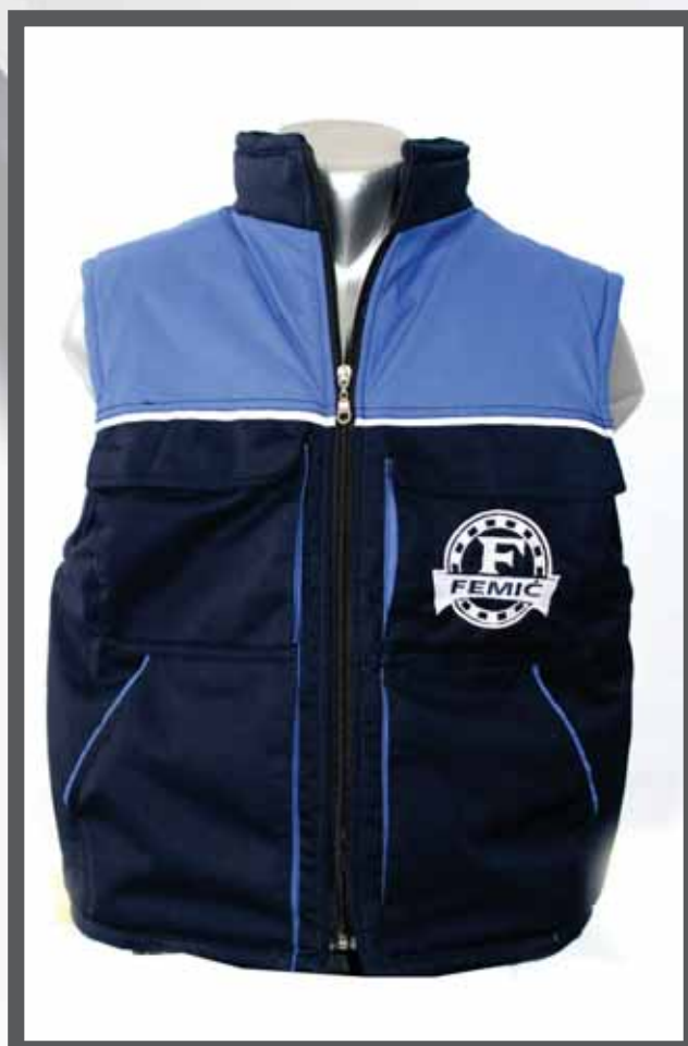
ŠIFRA PROIZVODA: 100-091