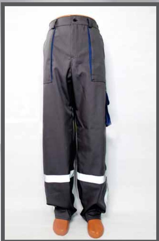
ŠIFRA PROIZVODA: 100-04