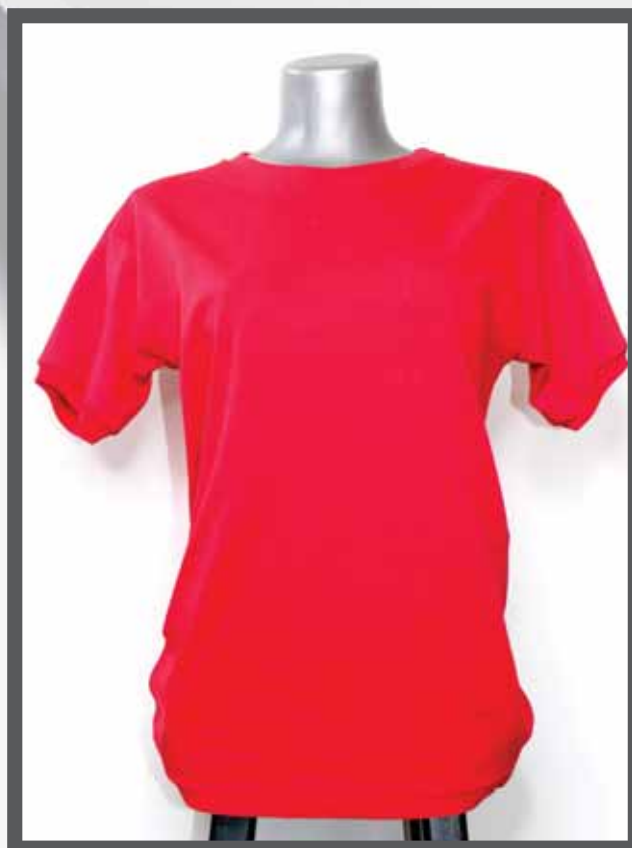
ŠIFRA PROIZVODA: 102 -022