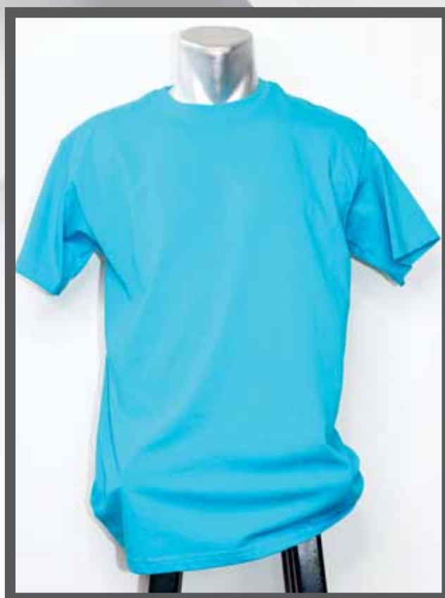
ŠIFRA PROIZVODA: 102 -09

NAZIV PROIZVODA: MUŠKA BLUZA KRATKI RUKAV