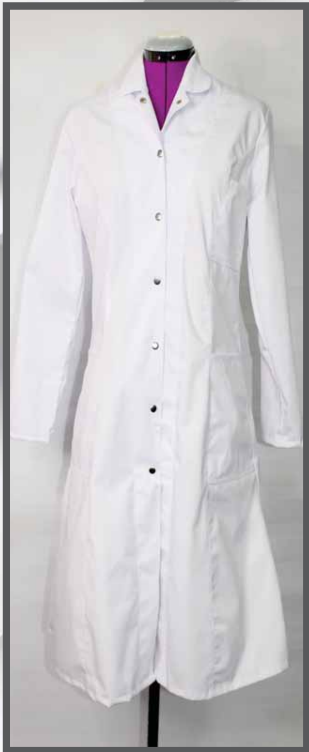
ŠIFRA PROIZVODA: 100-081