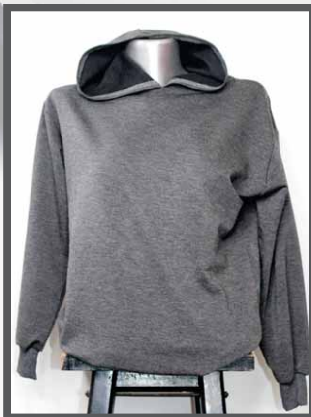
ŠIFRA PROIZVODA: 106 -08