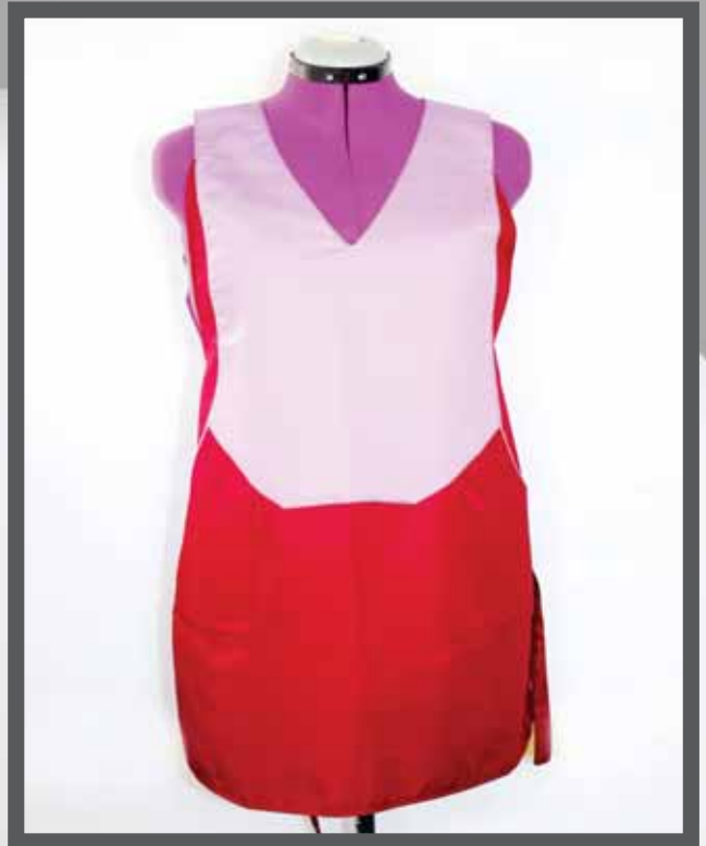
ŠIFRA PROIZVODA: 101-02