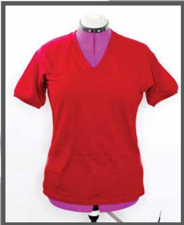
ŠIFRA PROIZVODA: 102-01