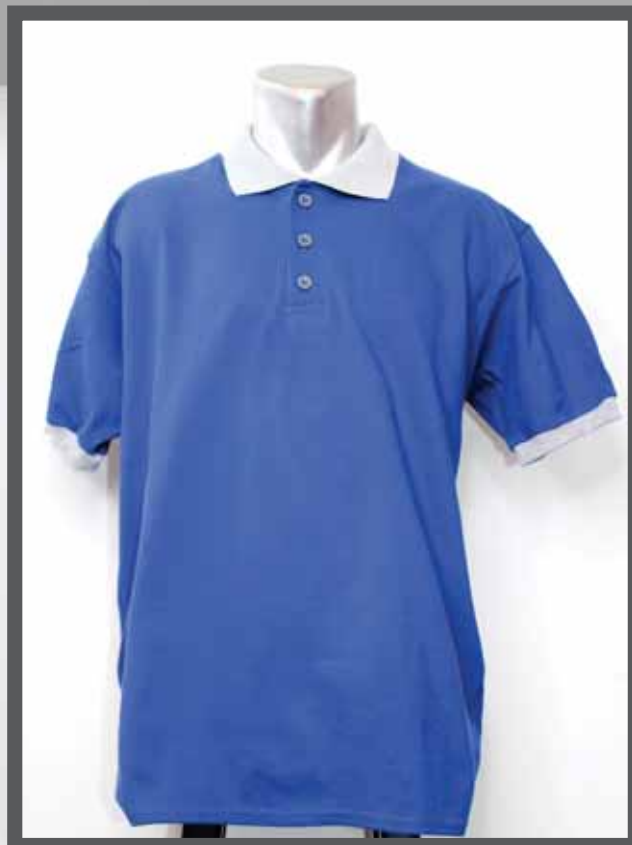
ŠIFRA PROIZVODA: 102 -016