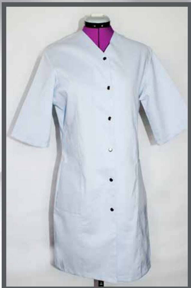
ŠIFRA PROIZVODA: 100-092