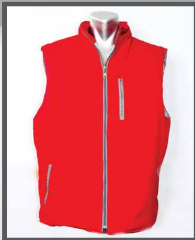
ŠIFRA PROIZVODA: 100-089