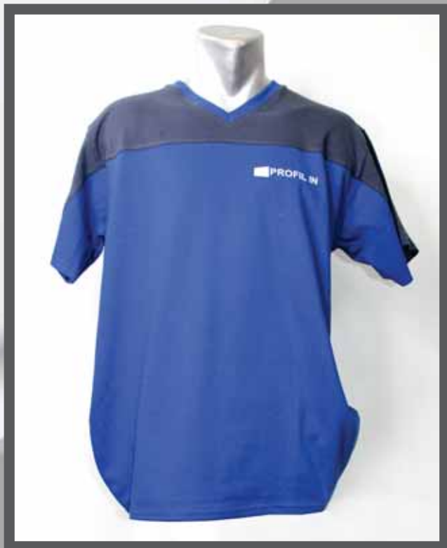
ŠIFRA PROIZVODA: 102 -010