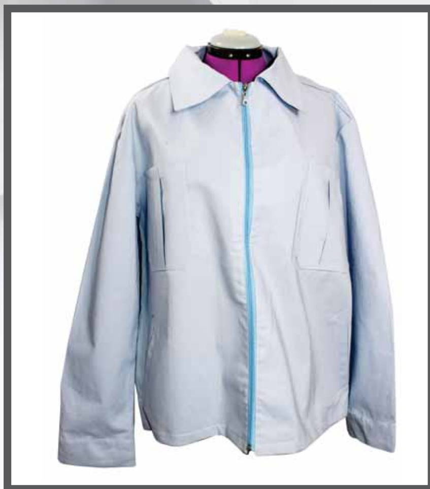
ŠIFRA PROIZVODA: 100-087