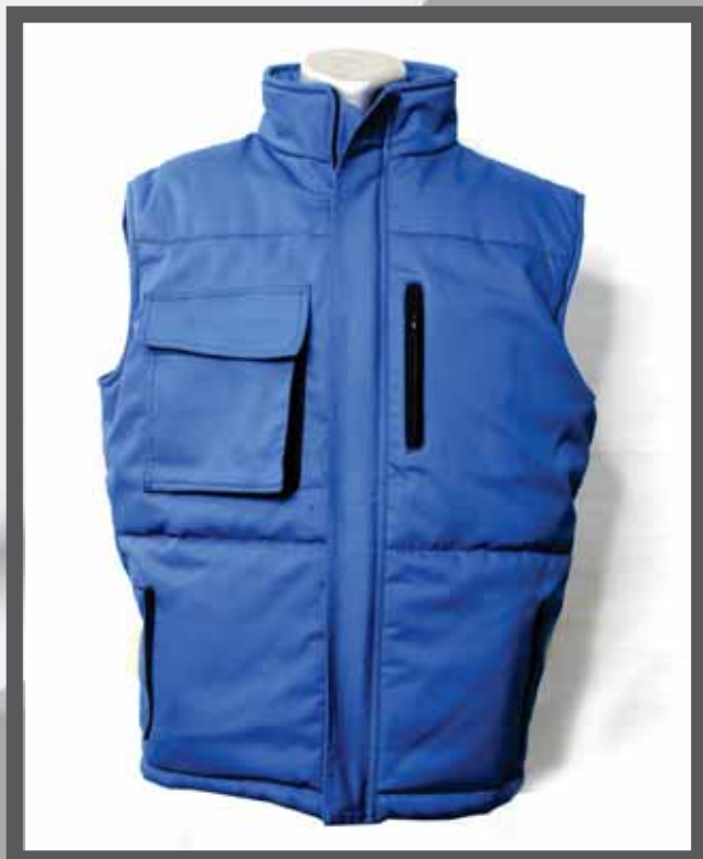
ŠIFRA PROIZVODA: 100-011