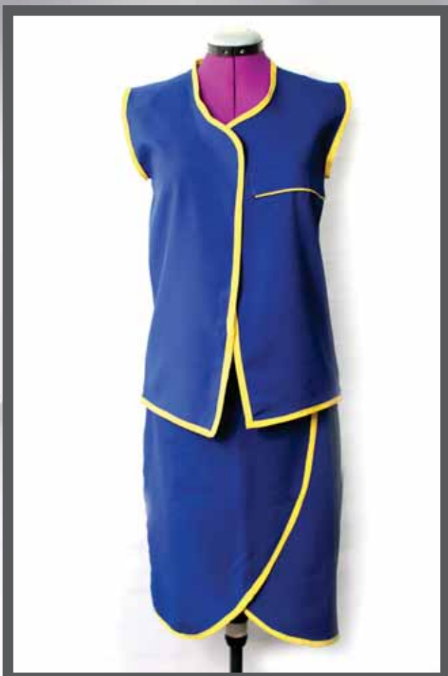
ŠIFRA PROIZVODA: 100 -094