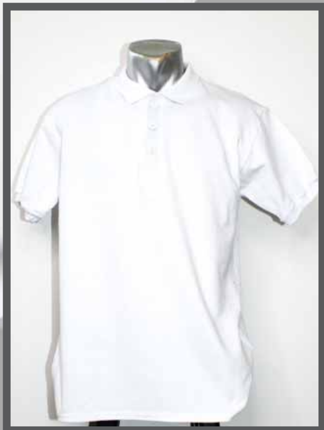
ŠIFRA PROIZVODA: 102 -07