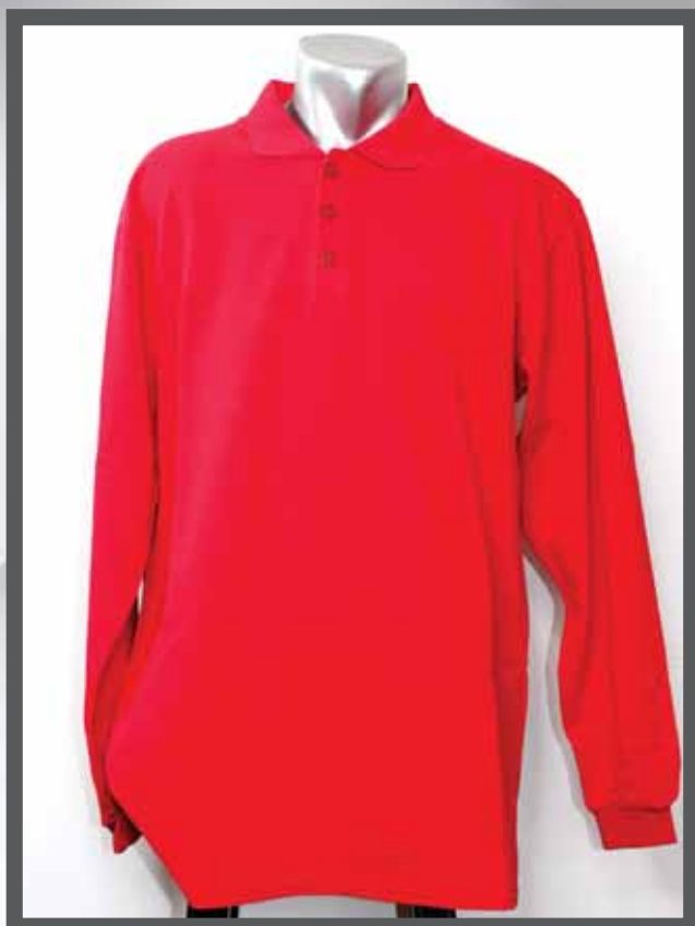
ŠIFRA PROIZVODA: 102 -05