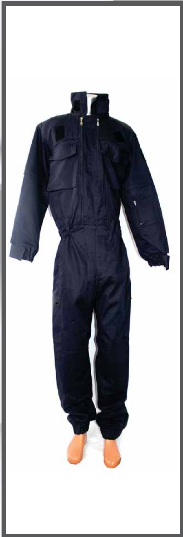
ŠIFRA PROIZVODA: 100-045