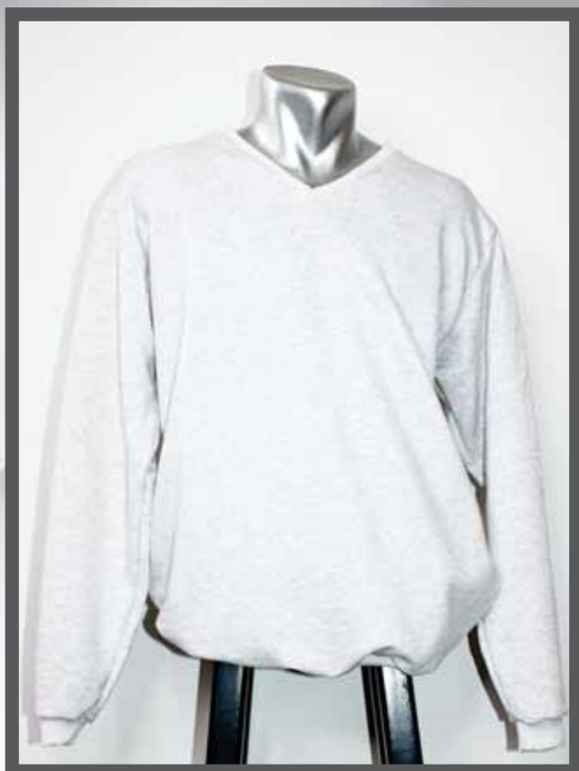
ŠIFRA PROIZVODA: 106 -03