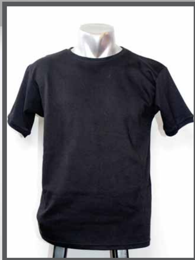
ŠIFRA PROIZVODA: 102 -08