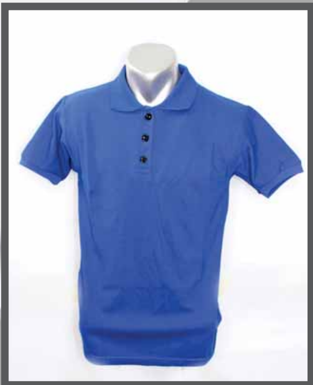
ŠIFRA PROIZVODA: 102 -02