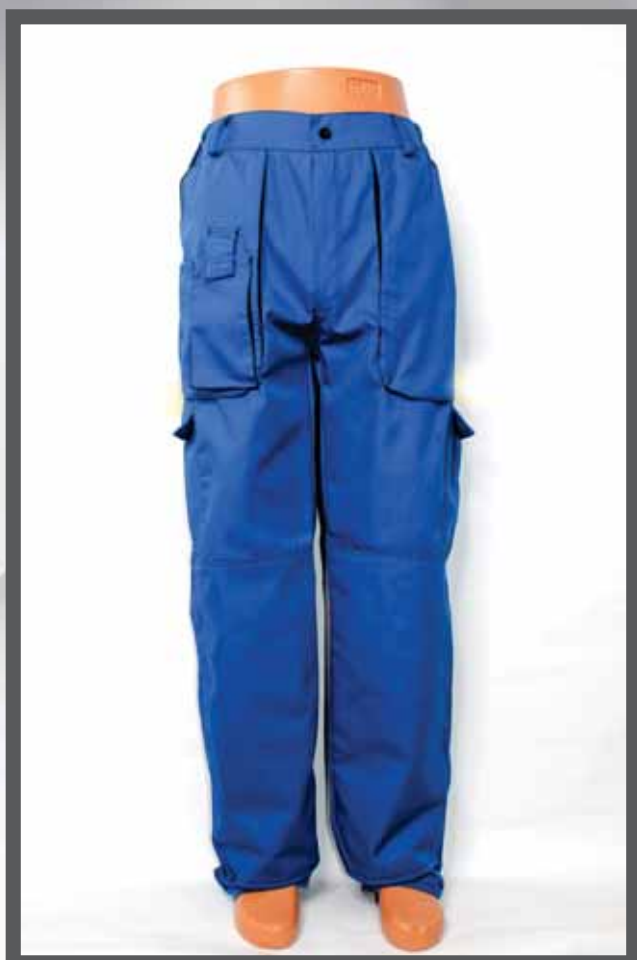
ŠIFRA PROIZVODA: 100-012