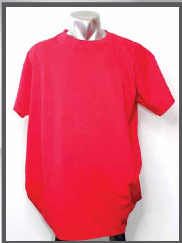
ŠIFRA PROIZVODA: 102 -017