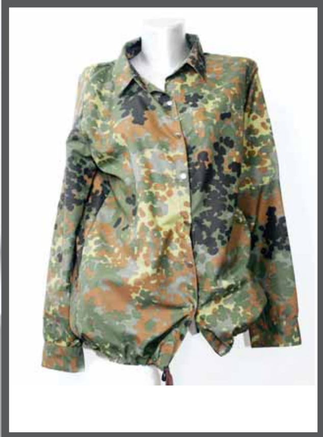
ŠIFRA PROIZVODA: 103 -01