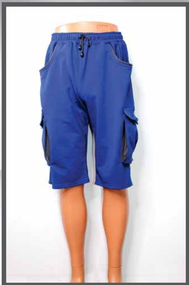
ŠIFRA PROIZVODA: 105 -02