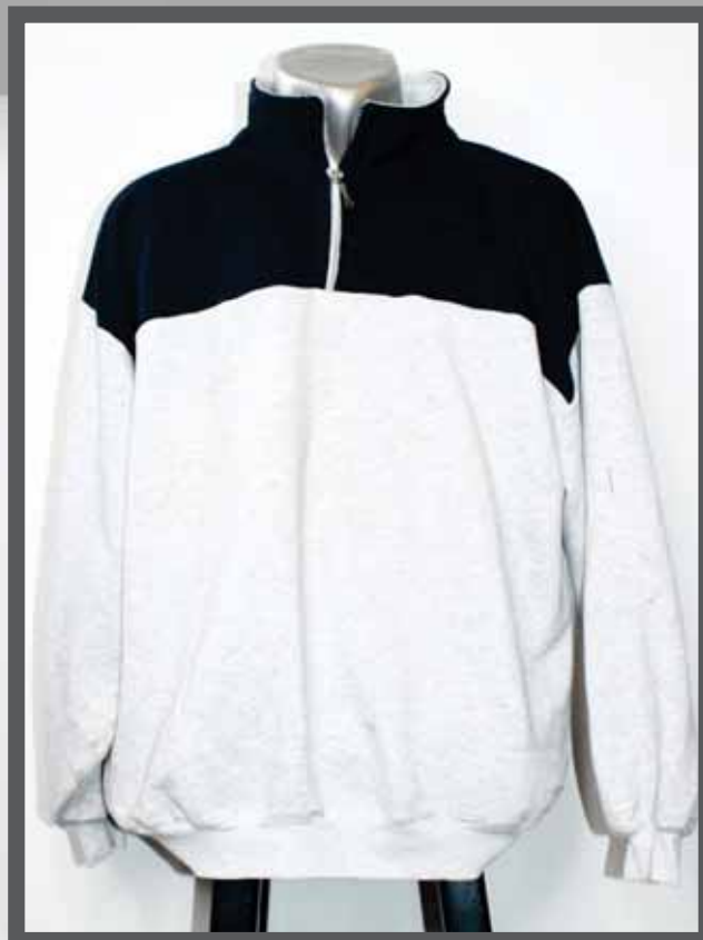
ŠIFRA PROIZVODA: 106 -02