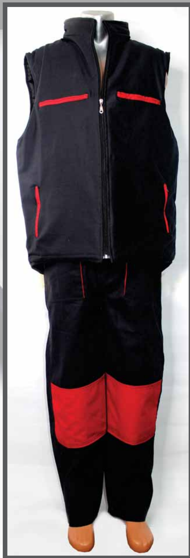
ŠIFRA PROIZVODA: 100-020