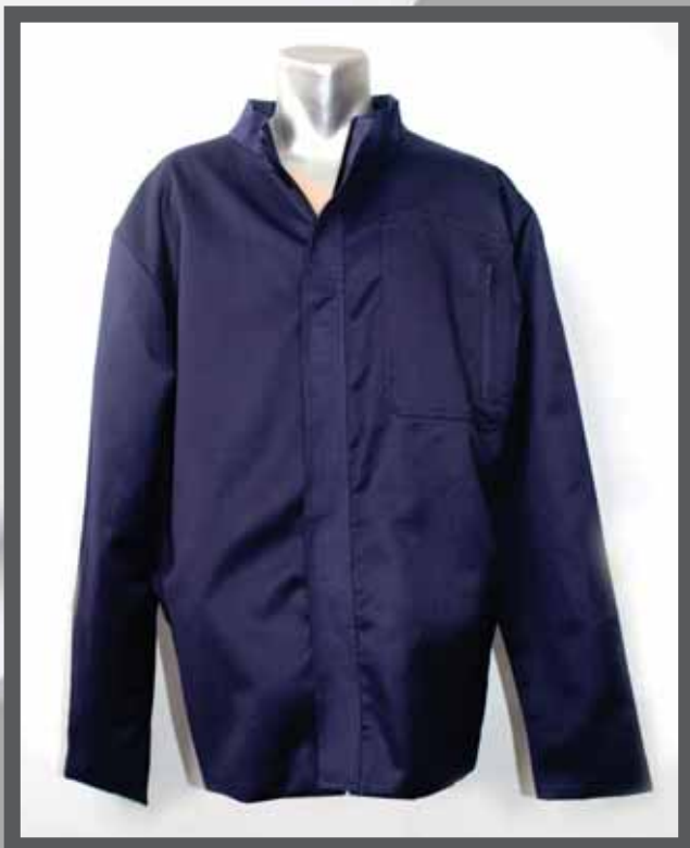
ŠIFRA PROIZVODA: 100-033