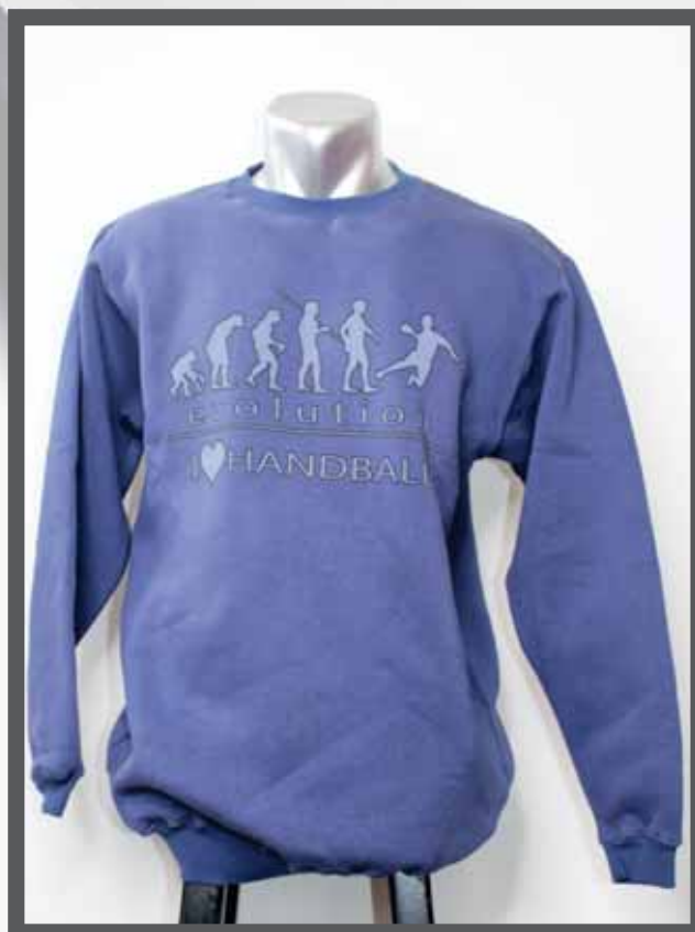
ŠIFRA PROIZVODA: 106 -04