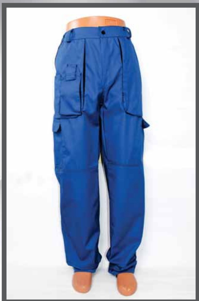
ŠIFRA PROIZVODA: 100-02