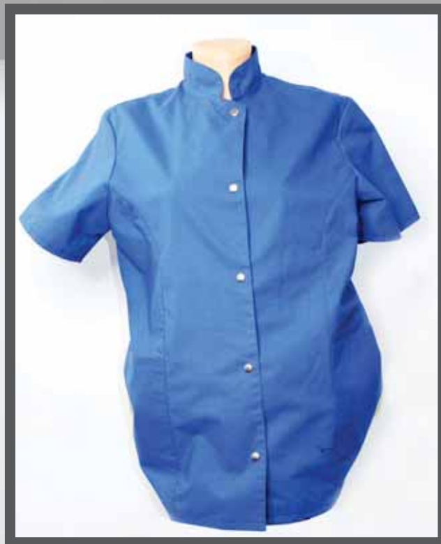
ŠIFRA PROIZVODA: 100-086