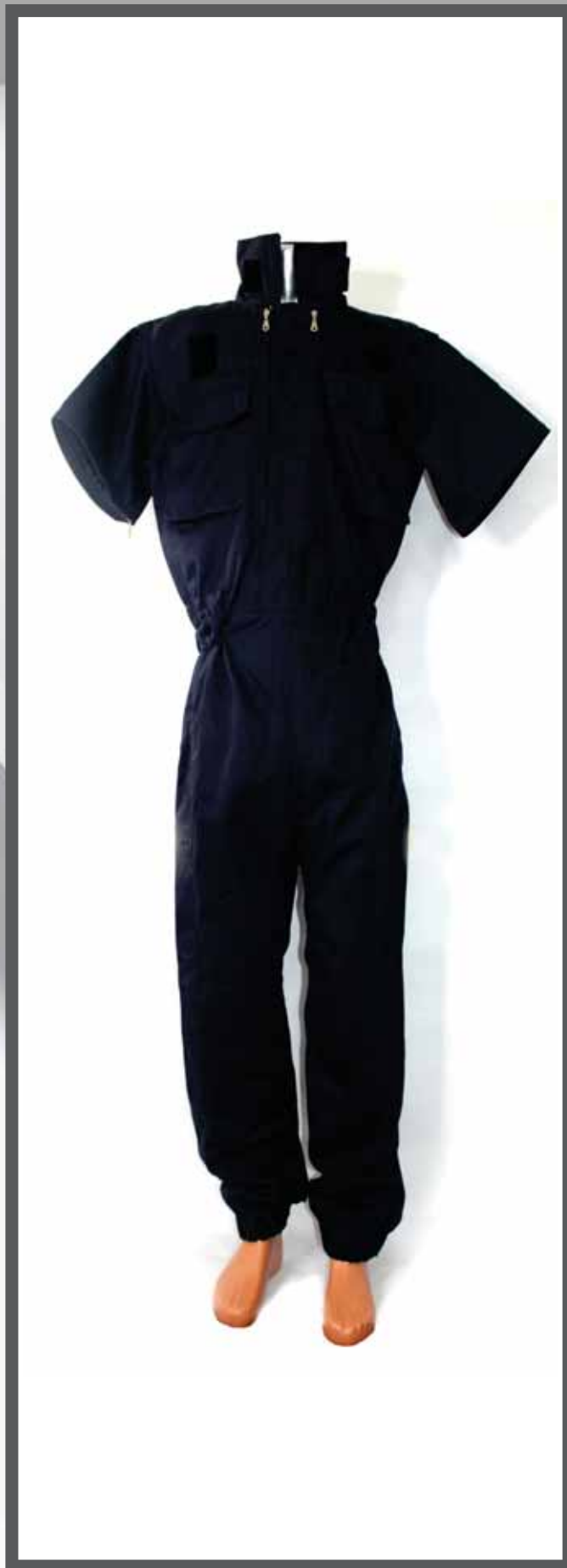
ŠIFRA PROIZVODA: 100-046