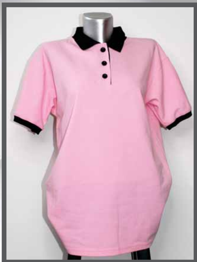
ŠIFRA PROIZVODA: 102 -026