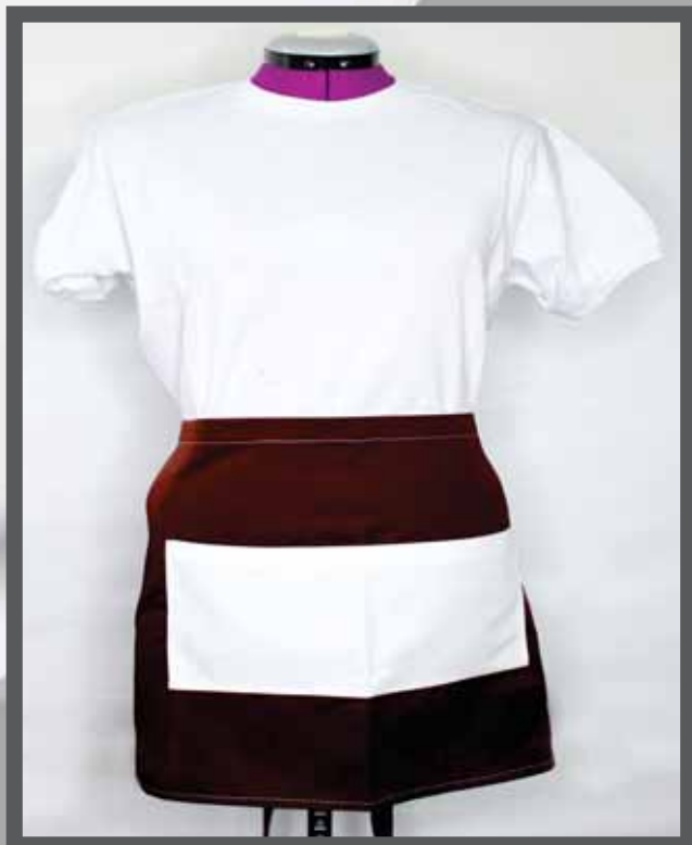
ŠIFRA PROIZVODA: 101-08