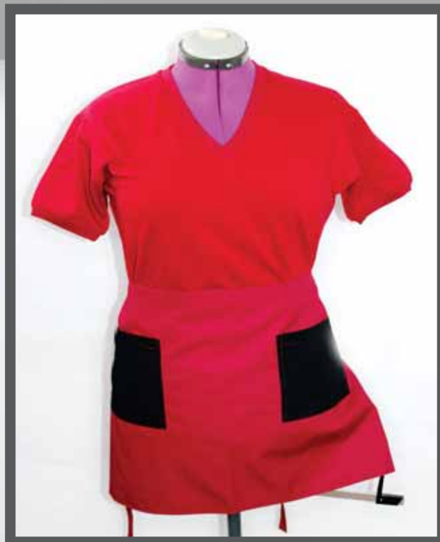
ŠIFRA PROIZVODA: 101-09