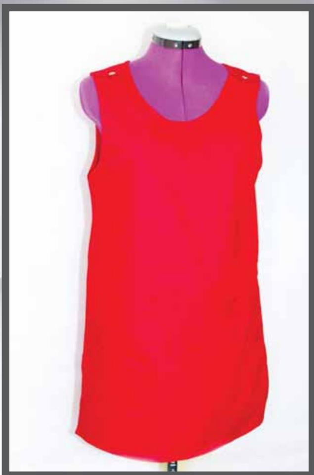
ŠIFRA PROIZVODA: 101-07