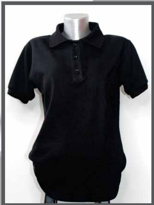
ŠIFRA PROIZVODA: 102 -024