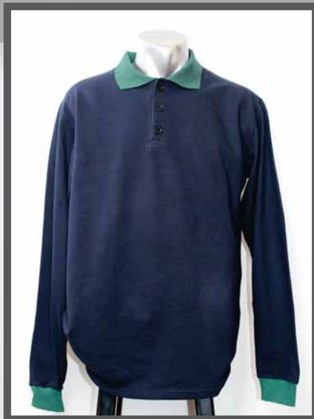
ŠIFRA PROIZVODA: 102 -04