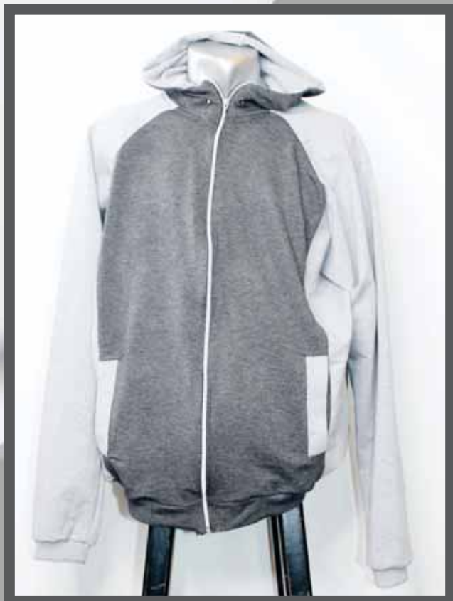
ŠIFRA PROIZVODA: 106 -01