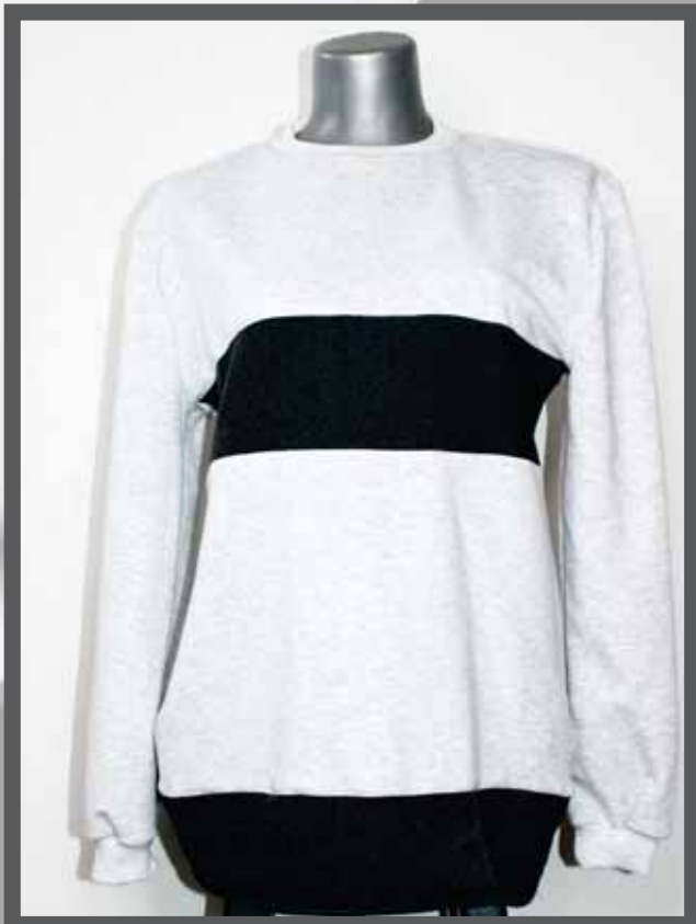
ŠIFRA PROIZVODA: 106 -05