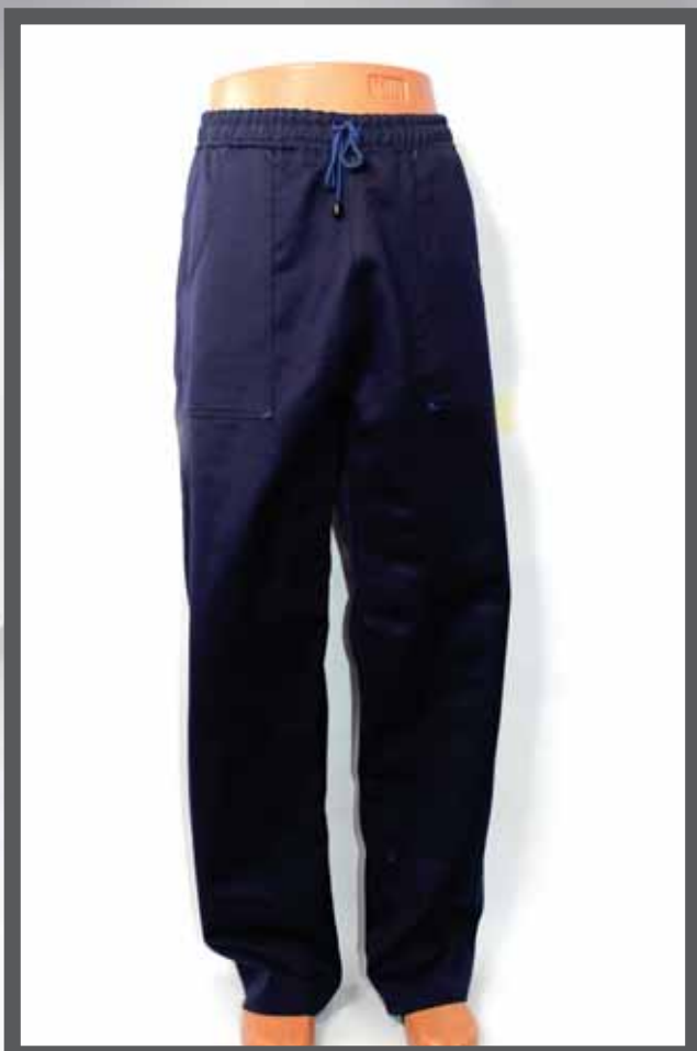
ŠIFRA PROIZVODA: 100-034