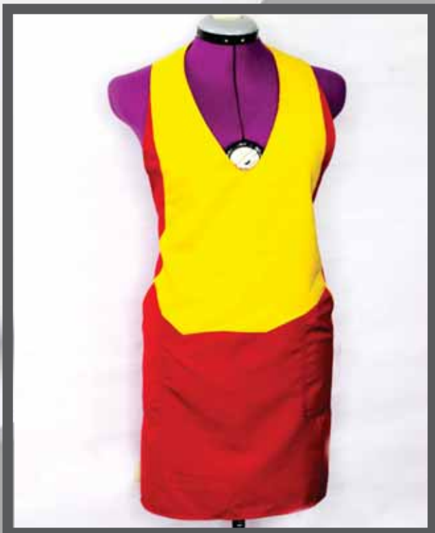
ŠIFRA PROIZVODA: 102-010