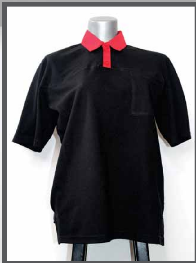
ŠIFRA PROIZVODA: 102 -025