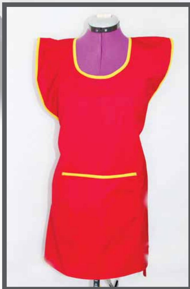
ŠIFRA PROIZVODA: 101-05