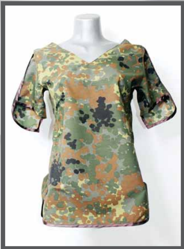
ŠIFRA PROIZVODA: 103 -02