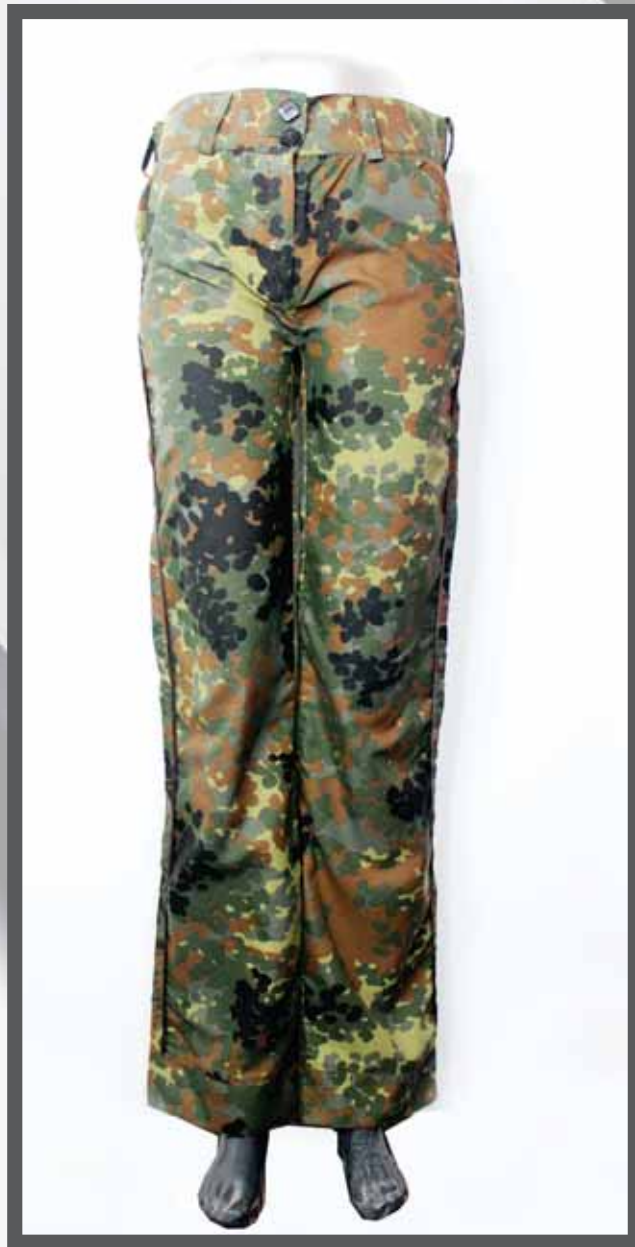
ŠIFRA PROIZVODA: 103 -03